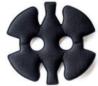
IMBOTTITURA TOP - TOP PADDING - MULLIDO DE LA PARTE SUPERIOR (Full face and Jet helmets)