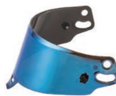
BLUE IRIIDIUM VISOR