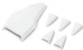
SET OF WHITE AIR INTAKES