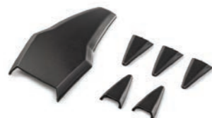
SET OF CLEAR AIR INTAKES