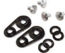
VISOR FASTENER KIT