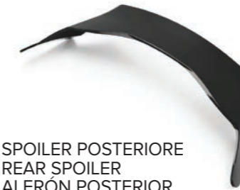
SPOILER POSTERIORE REAR SPOILER ALERÓN POSTERIOR

Lo spoiler posteriore stabilizza il casco alle alte velocità ed al tempo stesso favorisce l'estrazione dell'aria calda dal casco. The rear spoiler stabilises the helmet at high speeds and at the same time facilitates hot air extraction from the helmet. El alerón posterior estabiliza el casco en las situaciones de alta velocidad y favorece la extracción del aire caliente del casco.