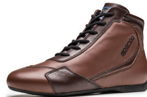
SLALOM RB-3 CLASSIC