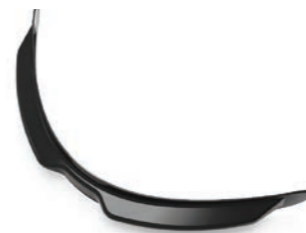
SPOILER ANTERIORE FRONT SPOILER ALERÓN ANTERIOR

Questi kit consentono di adattare al meglio il fitting del casco, scegliendo lo spessore adeguato alle proprie esigenze. L'installazione è semplice e veloce, grazie al fissaggio attraverso velcro. • These kits allow for the best possible helmet fitting, with the right choice of thickness for the user's needs. Installation is simple and rapid, thanks to the Velcro fastenings. • Estos kits permiten adaptar mejor el ajuste del casco al poder elegir el espesor adecuado para cada necesidad. La instalación es fácil y rápida gracias a la fijación con velcro.