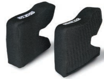
IMBOTTITURA GUANCE - CHEEK PADDING - MULLIDO EN LA PARTE DE LAS MEJILLAS (Full face helmets)